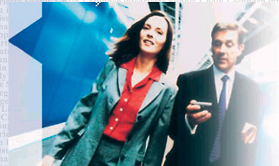
CANIAS ERP System - weit mehr als nur ERP-Software.